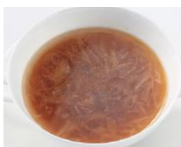
淡路たまねぎ スープ