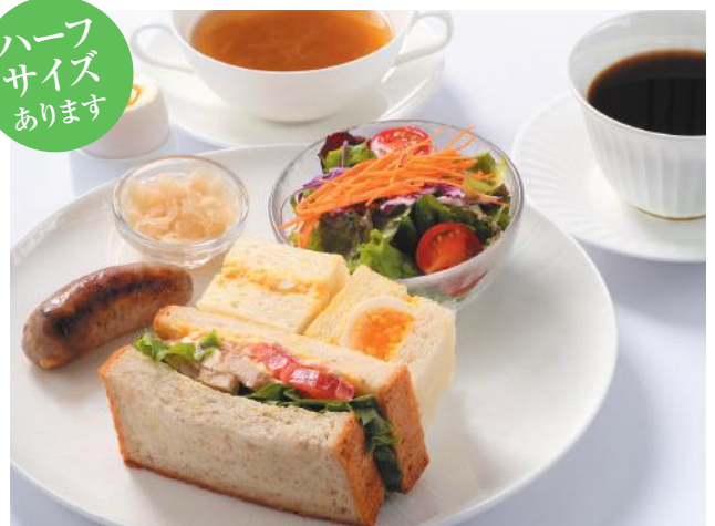
〈写真はオススメ追加サイドメニュー A + B のセットです〉