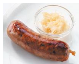
ラ・スイート特製 シャルキュトリ