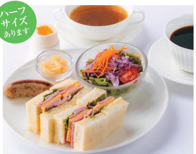
〈写真はオススメ追加サイドメニュー A + B のセットです〉