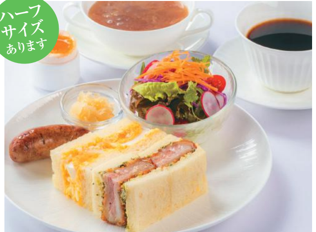
〈写真はオススメ追加サイドメニュー A + B のセットです〉