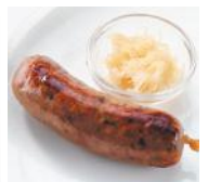
ラ・スイート特製 シャルキュトリ

※アレルギーや苦手な食材がある場合はお気軽にお申し付けください。 ※表示価格は「日本円」となります。 If you have any allergy in food or you do not eat, please kindly inform us. The prices above are in Japanese yen.