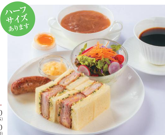
〈写真はオススメ追加サイドメニュー A+B のセットです〉

Plus One オススメ追加サイドメニュー A スープ +150 (税込 165) B ソーセージ +200 (税込 220)