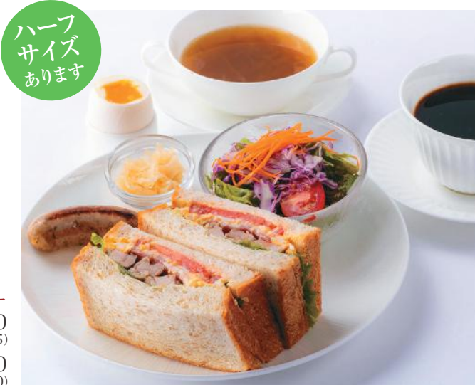
〈写真はオススメ追加サイドメニュー A+B のセットです〉

Plus One オススメ追加サイドメニュー A スープ +150 (税込 165) B ソーセージ +200 (税込 220)